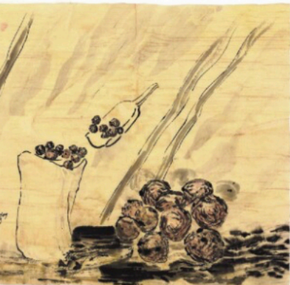
→ Olieballen spelen een rol in het werk van Wang (boven en rechtsomder), net als het typisch zilverachtige strijklicht waar de historische Hollandse schilderij kunst om bekend staat.